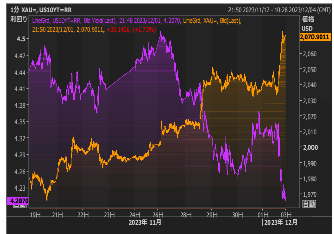
米長期金利とゴールド