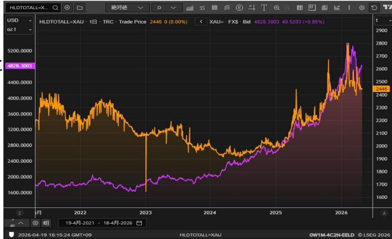
Gold ETF残高とゴールド価格

シルバーは80ドル台のせ。ちょうど今年のSilver Surveyが発表されて、供給不足が続くことが確認されたこともあり、じわじわと価格を切り上げて来ています。需給構造を考えるとやはりシルバーに関しては長期的な価格上昇は避けられないと感じます。