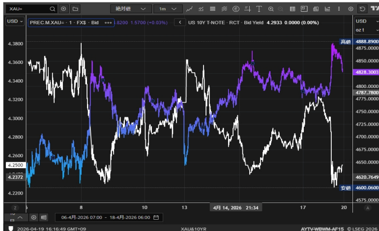
米長期金利とゴールド