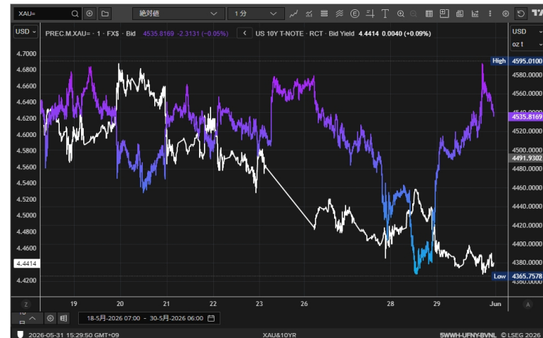
米長期金利とゴールド

プラチナは一時1900ドルを割り込む動きとなり頭が重たい展開が続いています。6月は昨年プラチナとパラジウムを上場したGFEXの6月限の最終取引日が来ます。そこでどれくらいの現渡しが成されるのか注目です。