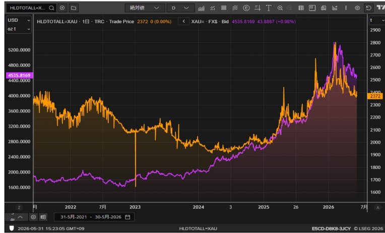
Gold ETF残高とゴールド価格

ゴールドが週中の下げから週初のレベルにもどったのとくらべてシルバーはそこまでの戻りがなく、投資家のゴールドとシルバーに向ける姿勢の違いなのかもしれません。シルバーはやはりボラティリティが大きく、投資家も安易には買えないと思っているのでしょうか。72ドルを割り込む安値は意外でした。74ドル以下を買い目標で先週も少し拾えました。