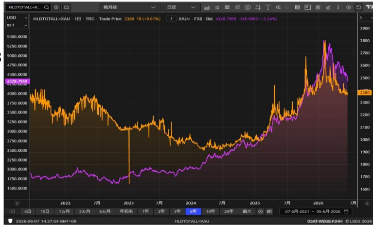
Gold ETF残高とゴールド価格