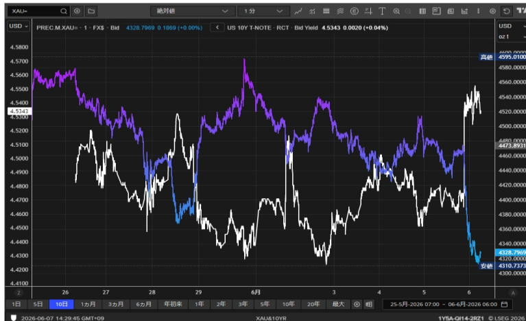
米長期金利とゴールド