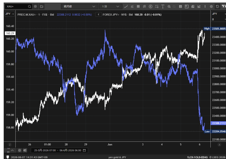
円建てゴールドとドル円

本資料のご利用については、必ず巻末の重要事項（ディスクレーマー）をお読み下さい。