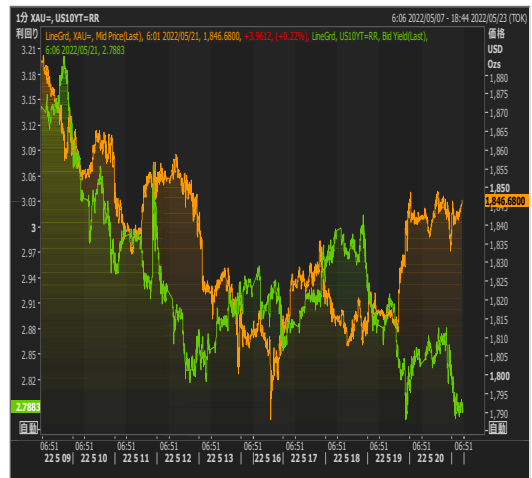
米長期金利とゴールド