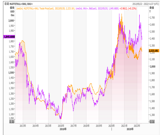
Gold ETF残高とゴールド価格