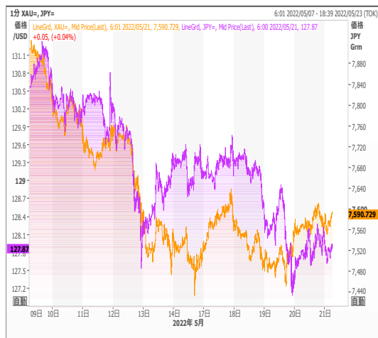
円建てゴールドとドル円