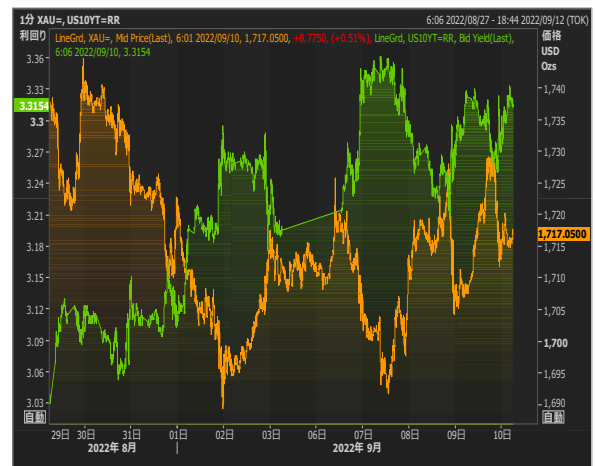
米長期金利とゴールド