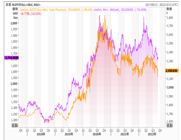
Gold ETF残高とゴールド価格