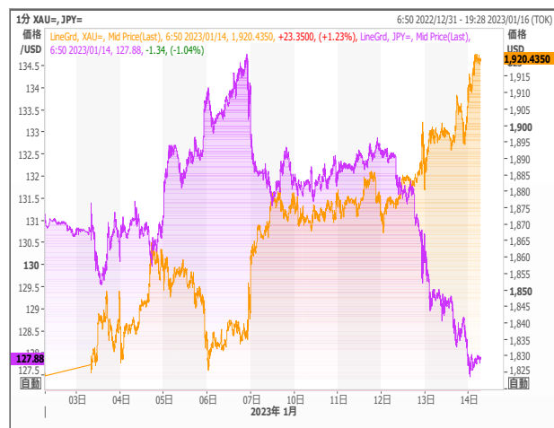
円建てゴールドとドル円

本資料のご利用については、必ず巻末の重要事項（ディスクレーマー）をお読み下さい。