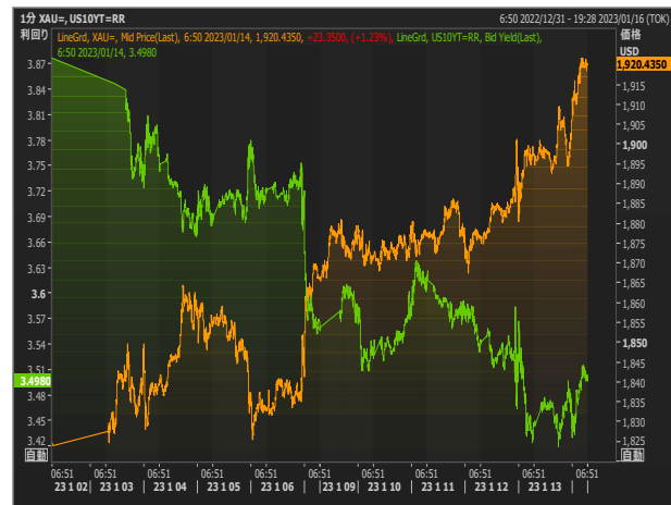
米長期金利とゴールド