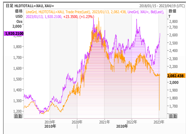
Gold ETF残高とゴールド価格