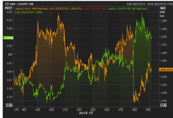
米長期金利とゴールド