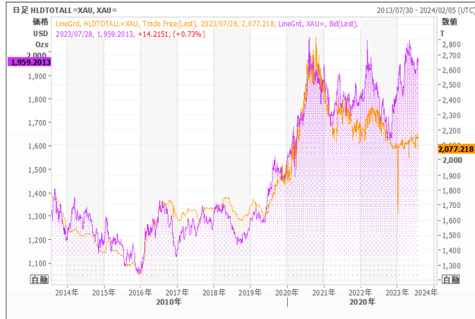
Gold ETF残高とゴールド価格