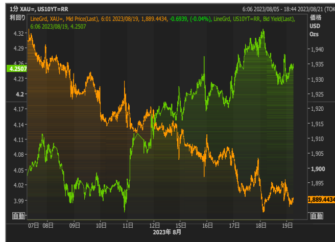
米長期金利とゴールド

ゴールドの下落に対して、プラチナは900ドル回復と逆に戻りとなりました。工業用メタルとしてその需要の最大である中国の不調が重しとなりましたが、中国のドル売り介入もあり、とりあえず売りも一服。そしてやはり800ドル台は底値という意識はマーケットではある程度共有認識であると思います。