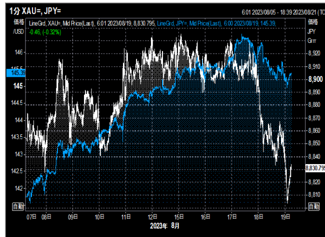
円建てゴールドとドル円