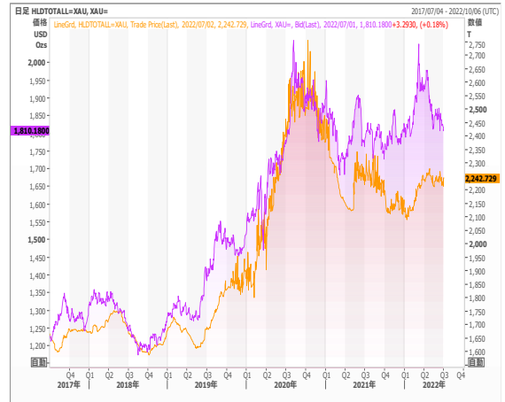
Gold ETF残高とゴールド価格