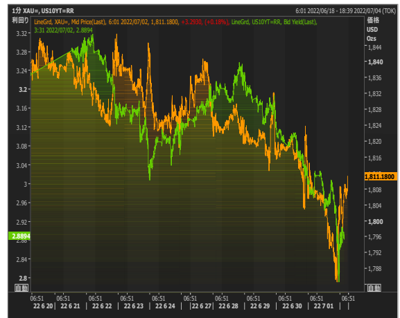
米長期金利とゴールド